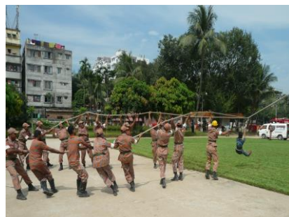
Links: Evakuierungsübung Philippinen